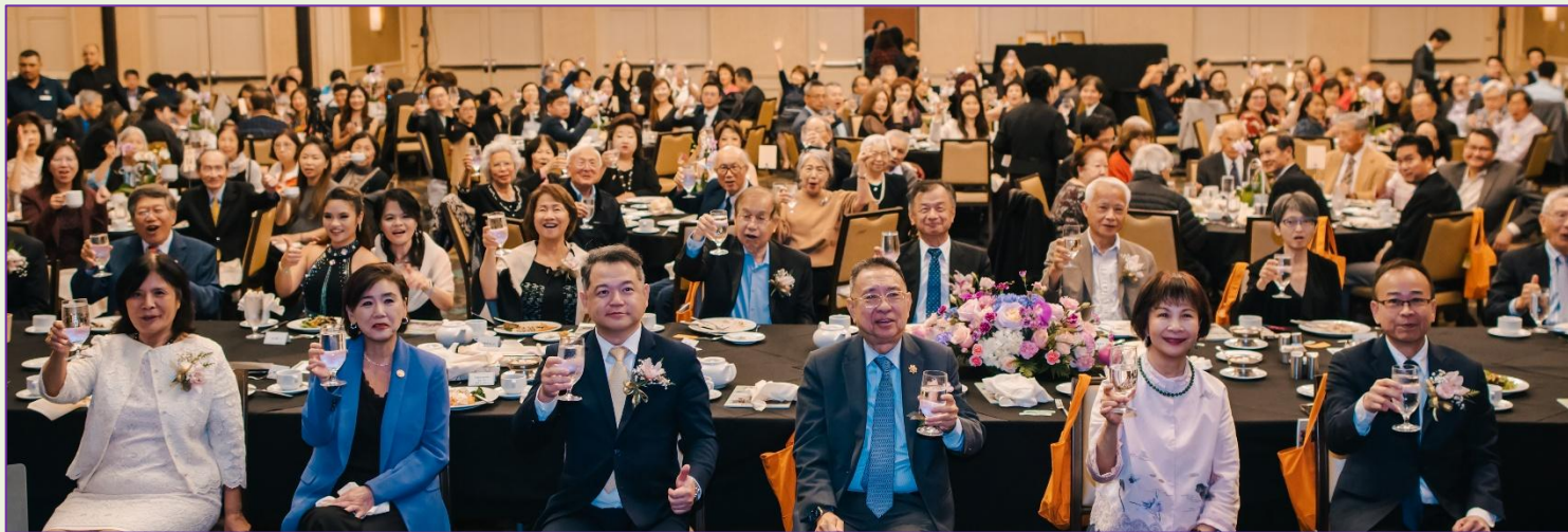
新館將趕在 2028 年 7 月洛杉磯奧運賽前落成迎賓，大家舉杯歡慶，齊聲歡呼！