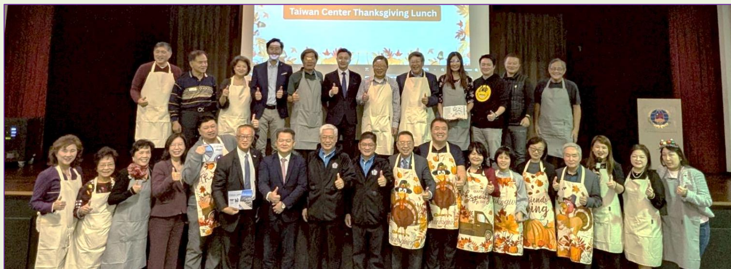
會館董事義工群與貴賓合影。

會館每年在感恩節前夕都會舉辦「海外留學生感恩節餐會」，今年也不例外，由於會館正逢重建階段，今年首次移至洛杉磯僑教中心舉行。11月23日，約150位旅居洛杉磯的台灣留學生齊聚一堂，現場充滿濃厚的溫馨與感恩氛圍。