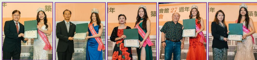
頒發 2025 永久會員感謝狀。