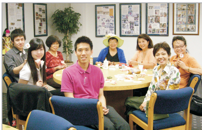
↑ 紙玫瑰花增添生活美意。