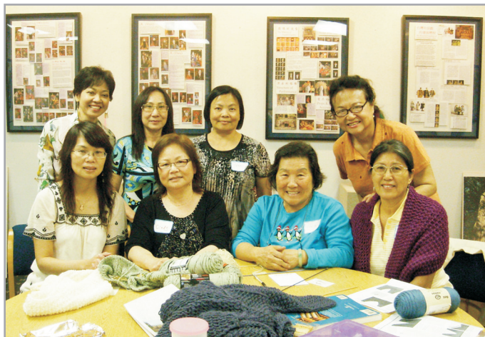
↑ 手工毛線班和樂融融。