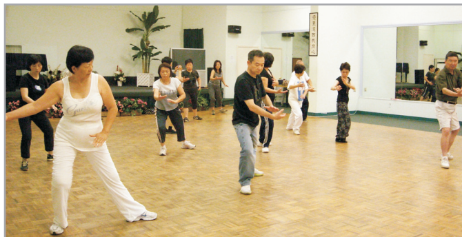
↑ 太極拳令人氣定神閒。