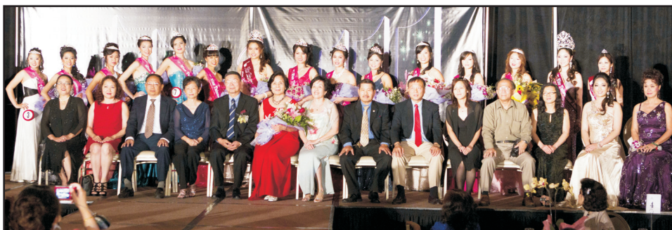
· 2011年台美小姐選拔圓滿成功。