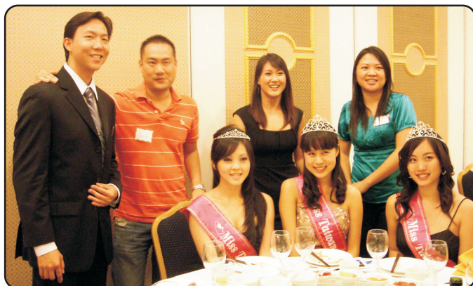
↑ 台美小姐參加台美商會青商部年會