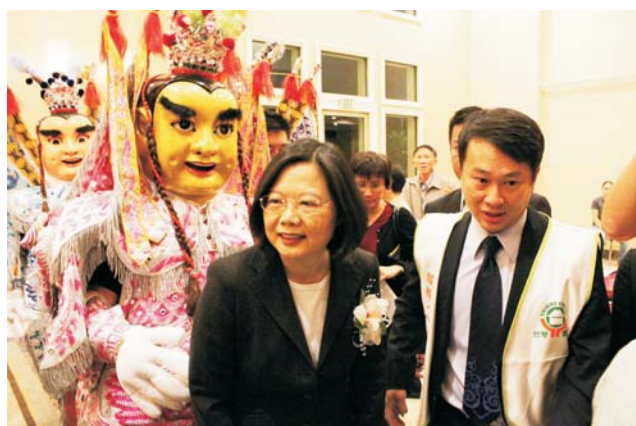
↑ 台灣會館三太子迎接蔡英文入場。