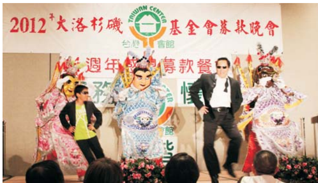
• 三太子熱歌勁舞，High到最高點。