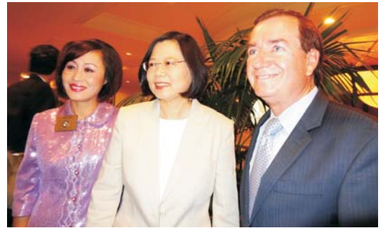
• 國會議員Ed Royce、核桃市長蘇王秀蘭也來向蔡英文致意。