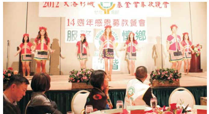
• 除走秀外，台美小姐加碼演出原住民舞蹈。