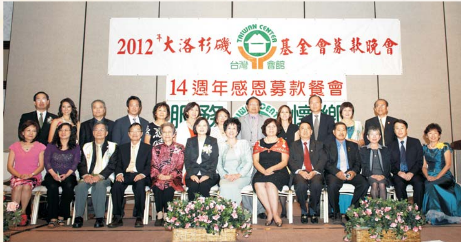
· 台灣會館14週年感恩募款餐會後董事合影。