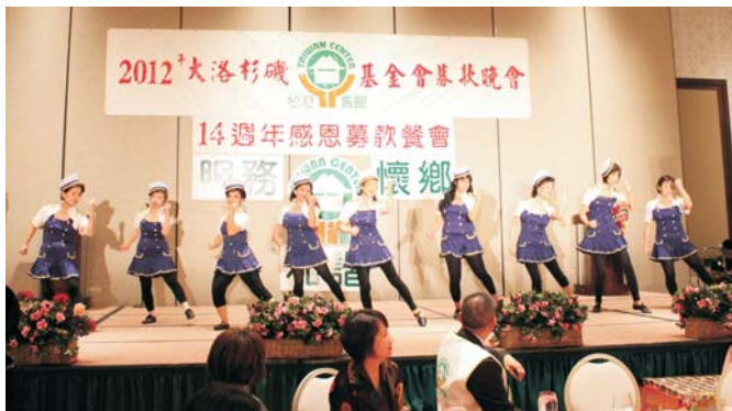
• 台灣會館舞蹈團表演「飛躍吧，海洋國家」，彰顯台美人文化的推廣與創新。