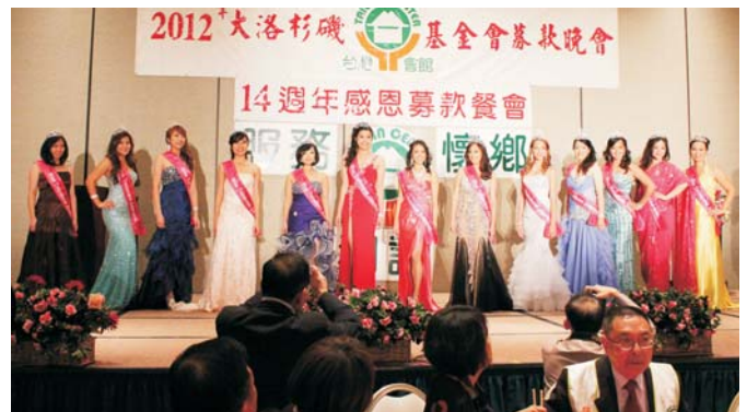
• 台美小姐亮麗走秀晚會吸睛。